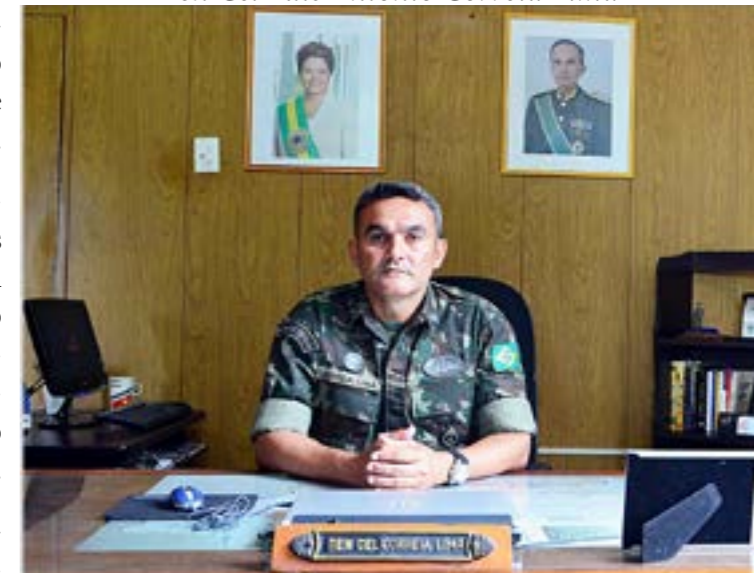
Comandante do 56º Batalhão de Infantaria

A participação do 56º BI na execução das ações voltadas para segurança dos grandes eventos proporcionou motivação para tropa e aumentou o espírito militar.