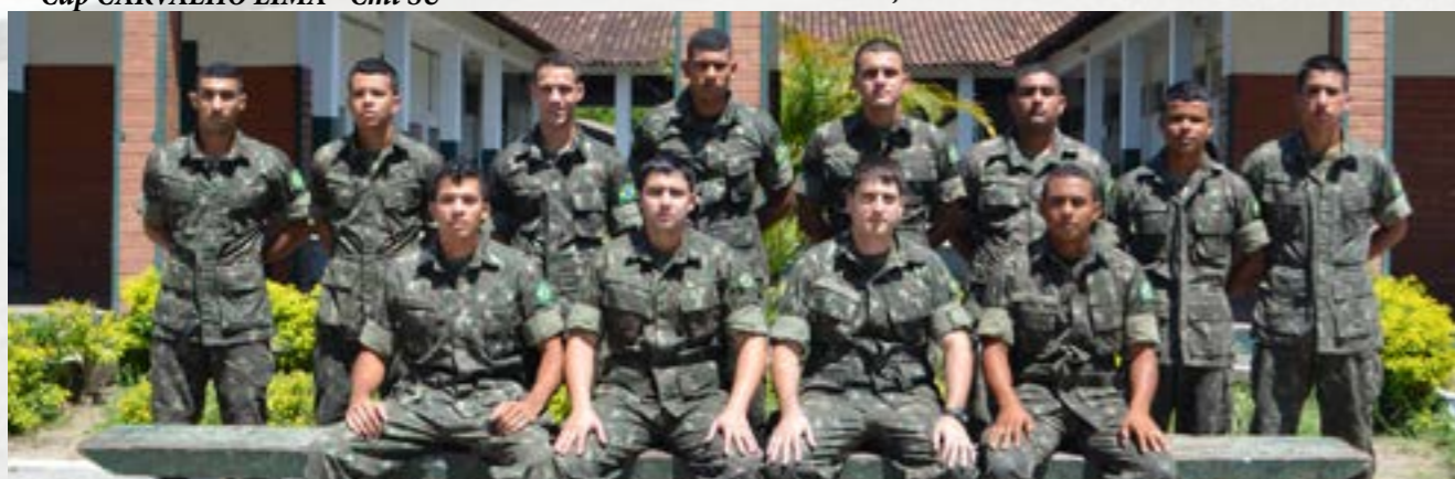
1º PELOTÃO DE FUZILEIROS