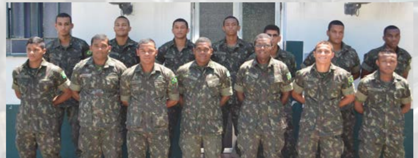
Pelotão de Suprimento