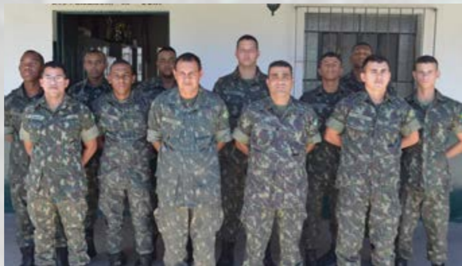
Pelotão de Comando