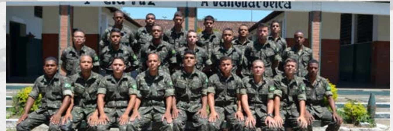
3º PELOTÃO DE FUZILEIROS