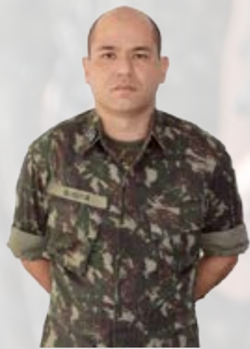
Cap SUGYA - Cmt SU