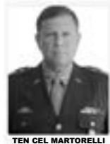
TEN CEL MARTORELLI