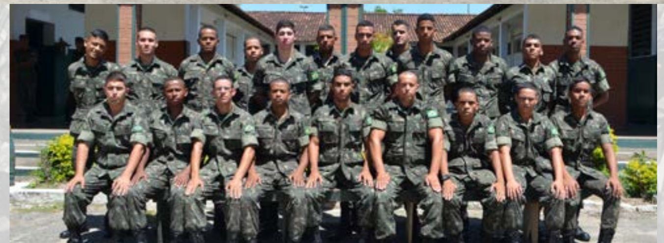
2º PELOTÃO DE FUZILEIROS