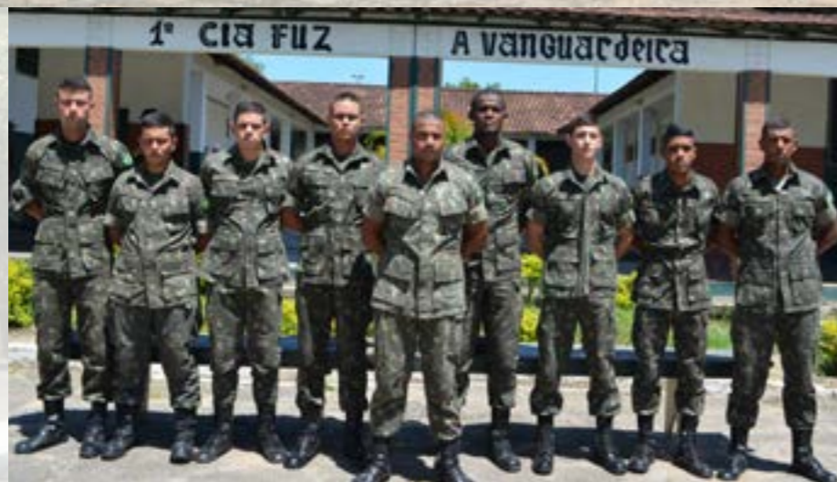
SEÇÃO DE COMANDO