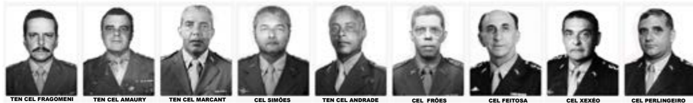
TEN CEL FRAGOMENI TEN CEL AMAURY TEN CEL MARCANT CEL SIMÕES TEN CEL ANDRADE CEL FRÖES CEL FEITOSA CEL XEXÉO CEL PERLINGEIRO