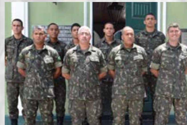
Pelotão de Comunicações