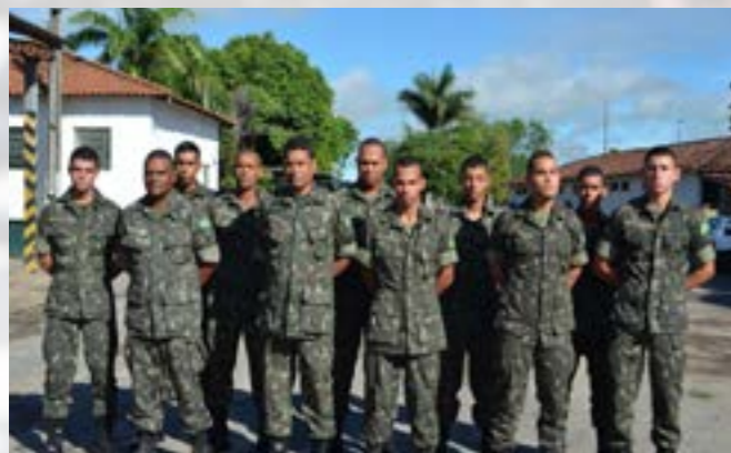
Pelotão de Obras