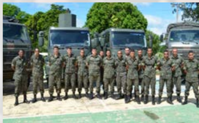
Pelotão de Transportes